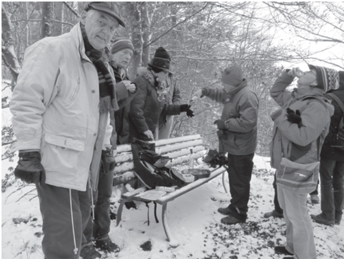
Ein Schlückchen in Ehren ...