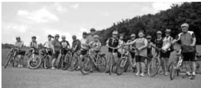
Die Gruppe aller Teilnehmer, startklar für die Rückfahrt

Oben am Gegenhang befand sich die Ruine Hohenmelchingen, eine der größten Burgruinen auf der Sonnenalb. Die meisten fuhren noch mit hinauf, um diese zu besichtigen.