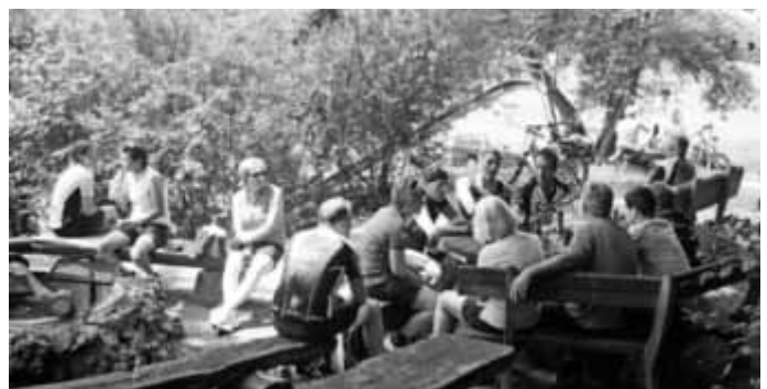
Rast am Abenteuerspielplatz