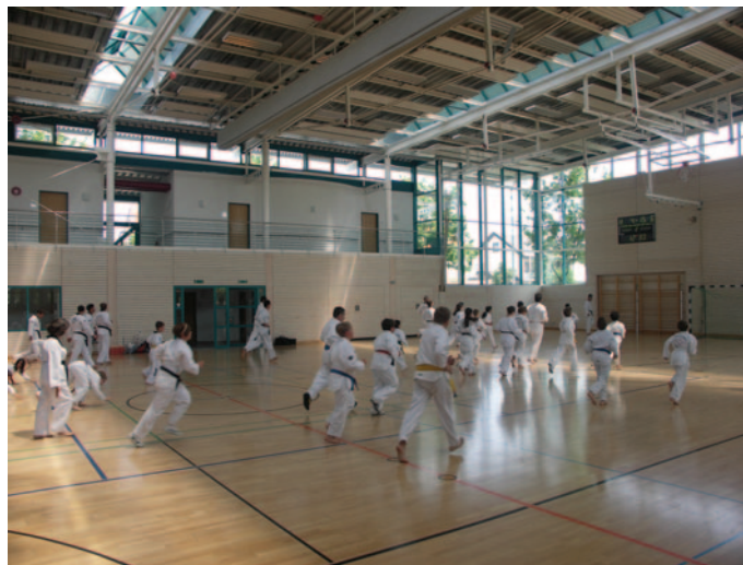
Alters- und graduierungsübergreifende Trainings-Einheit

Neueinsteiger sind altersunabhängig jederzeit willkommen und können individuell in die Sportart eingewiesen werden. Leichte Trainingsbekleidung genügt.