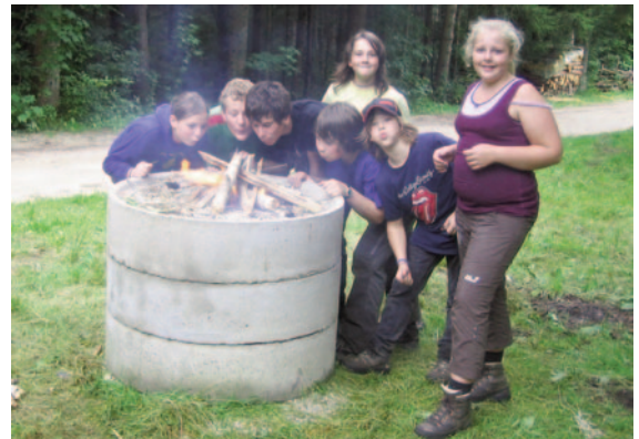
Alle hatten Spaß beim ersten Bitzer Feuer-camp

Eine Beschreibung der Aktion findet Ihr unter den Vereinsnachrichten bei „Musikkapelle Bitz“.